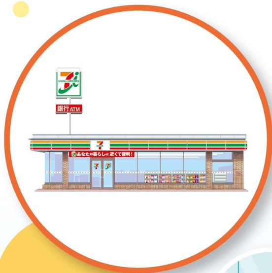
セブン-イレブンで

セブン-イレブンをはじめ、駅、商業施設、空港など 全国に25,000台以上あって、とっても便利!